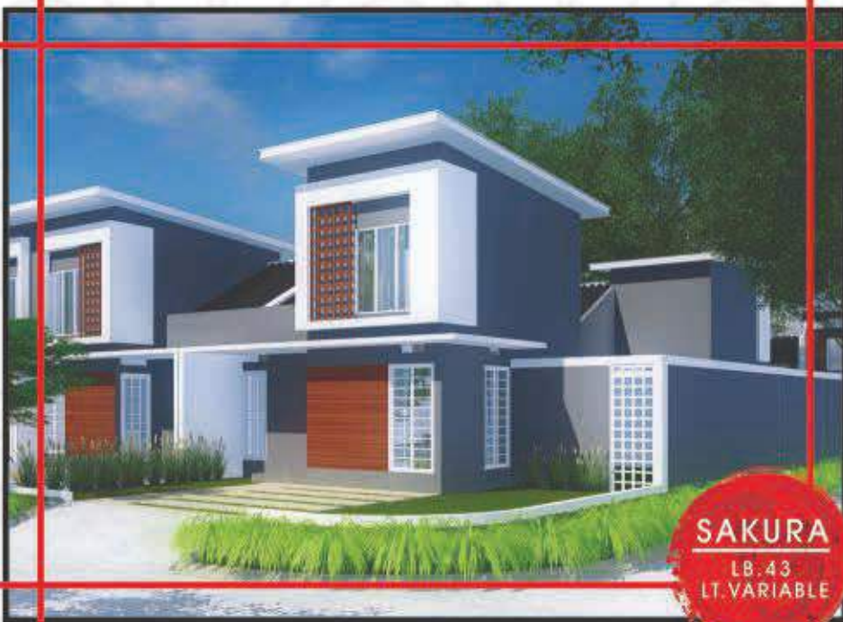
SAKURA LB. 43 LT. VARIABLE