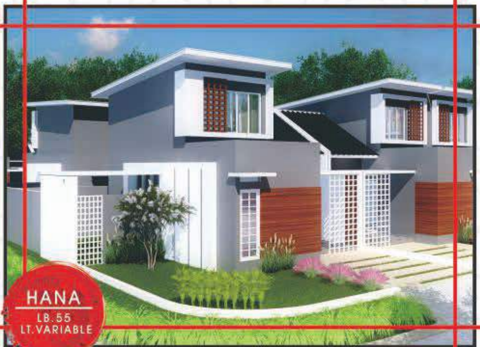
HANA LB. 55 LT. VARIABLE